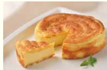
フォンダンフロマージュ