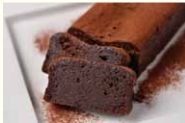
フォンダンショコラ

引き菓子として好評の「フォンダンショコラ」 「フォンダンフロマージュ」などの焼き菓子を いつでもご購入いただけるようになりました。 また、オリジナルケーキ「ミルシュ」や 「ガトーフレーズ」「ショコラノワール」など 洋生菓子もたくさんご用意しております。